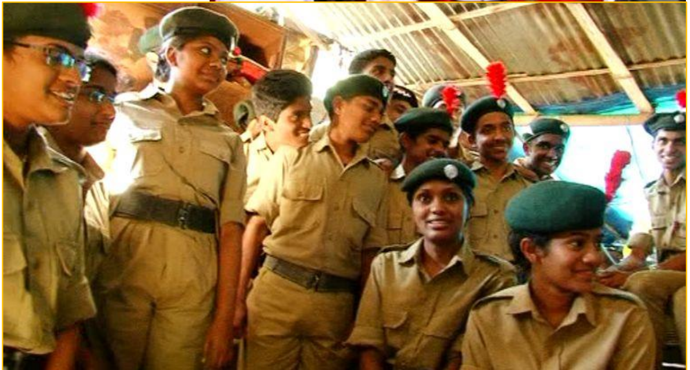
Bild Oben: Bishop von Idukki eröffnet das Programm. Bild unten: nationale Kadetten Korps-Helfer