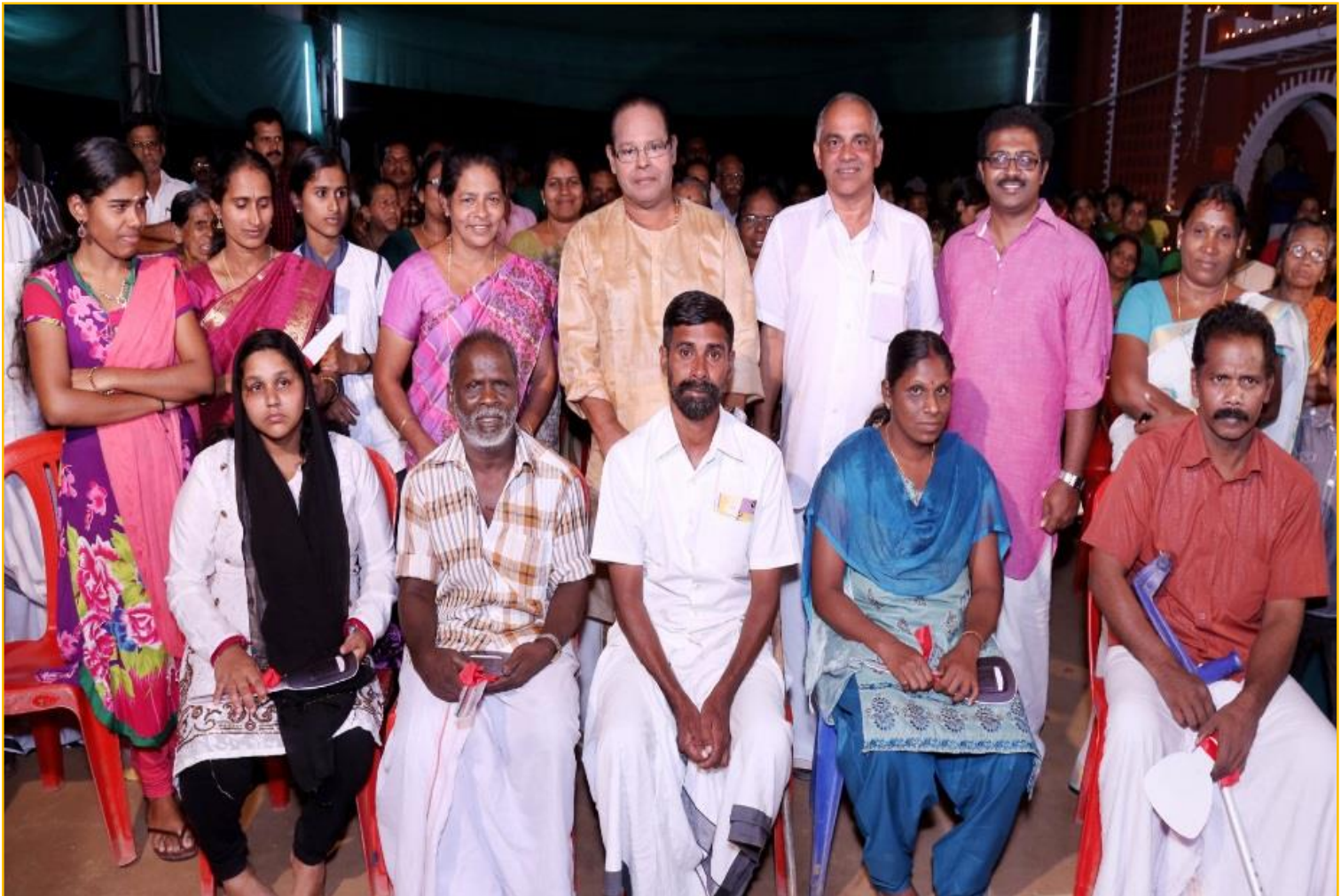
Herr Innocent, Mitglied des indischen Parlaments in Neu-Delhi, übergab 5 bedürftigen Menschen die umgebauten 3-Rad Motorroller am 26. Januar 201

Light in Life hat im Jahr 2015 CHF 4`290.- für das Projekt aufgewendet