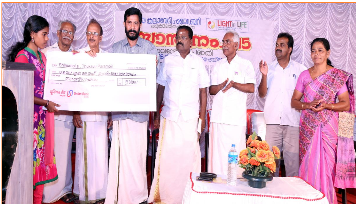
26. Januar 2015: Übergabe von Finanzhilfe an Studierende für eine Berufsausbildung

„Light in Life“ hat im 2015 CHF 12'752.- für dieses Projekt aufgewendet