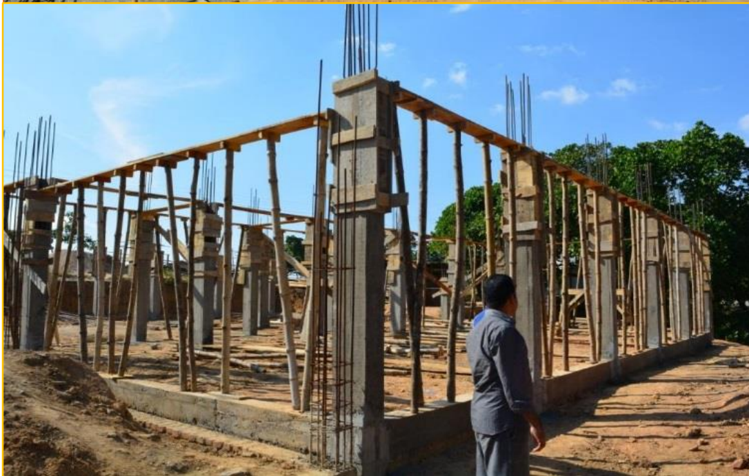
Bau Beginn: Das Schulgebäude