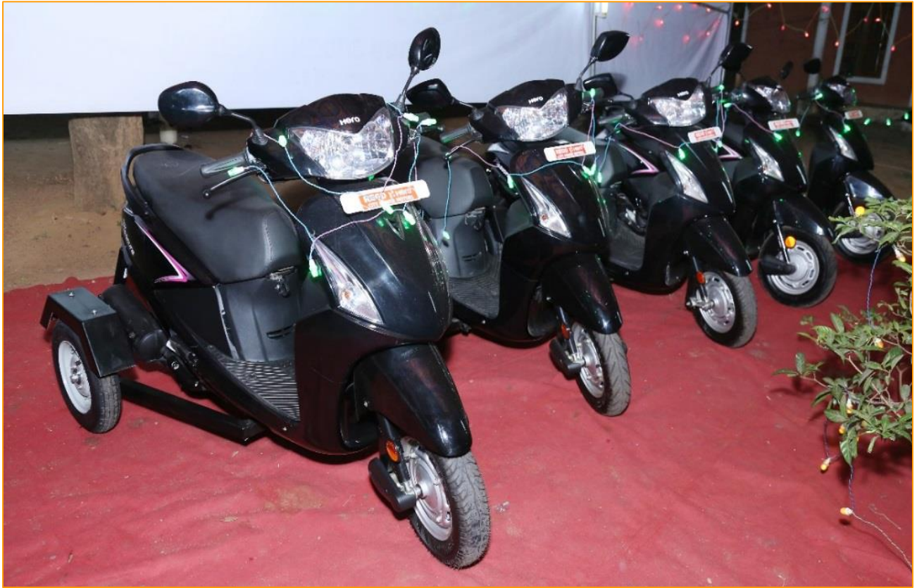
Behindertengerecht umgebaute 3-Rad Motorroller