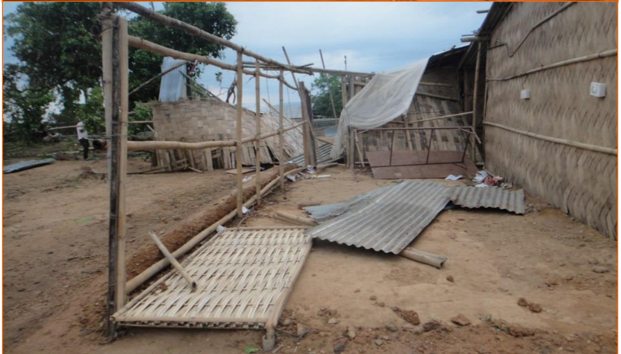
Das zerstörte Schulhaus