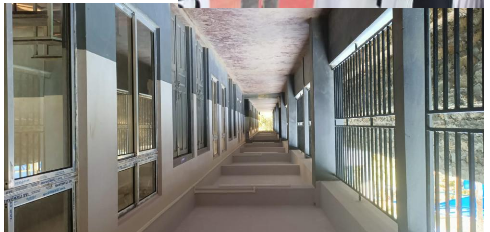
Bilder oben: Impressionen vom Schulhaus und von der feierlichen Eröffnung in Lengpui